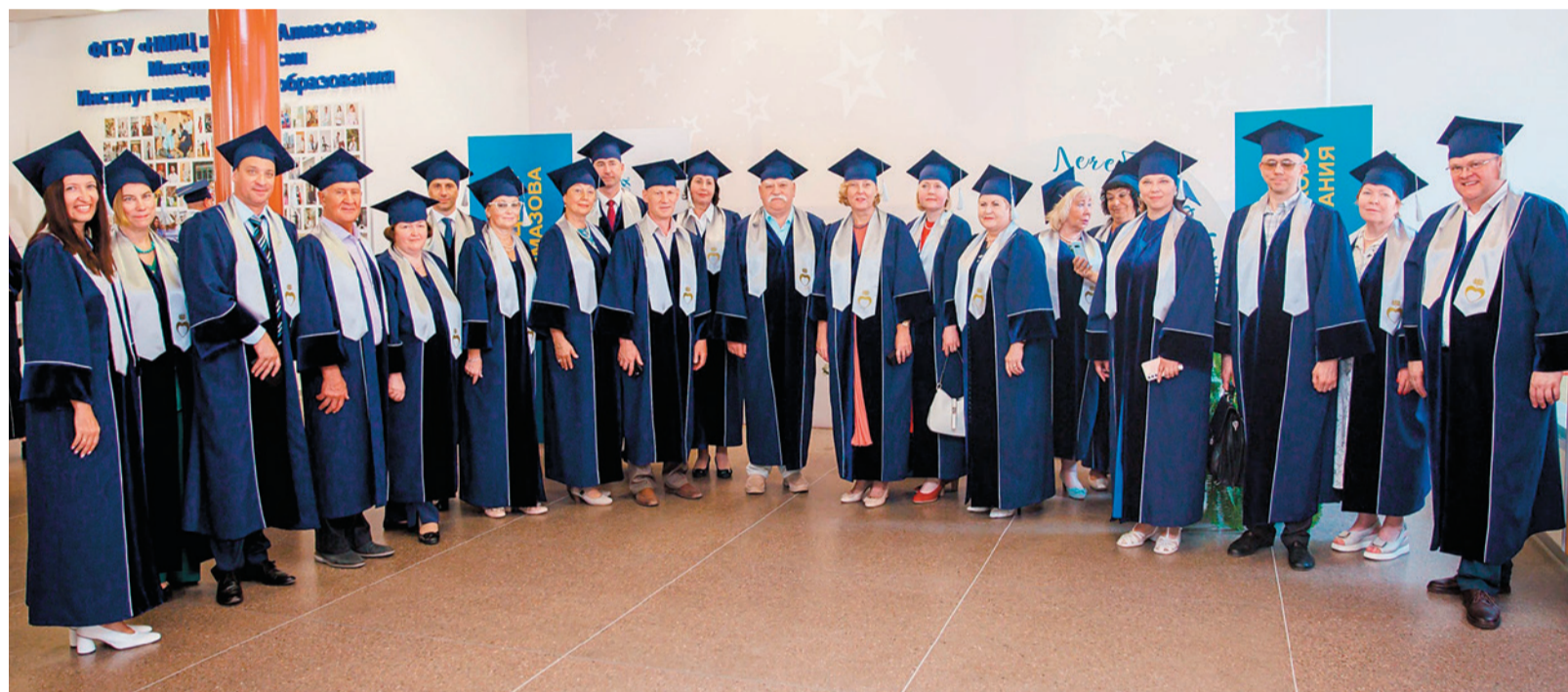
Профессорско-преподавательский коллектив Института медицинского образования Центра Алмазова

деканат факультета послевузовского и дополнительного образования