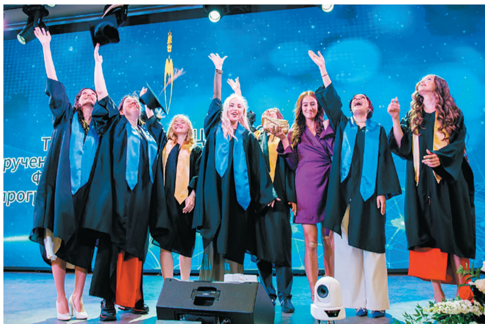
Первые выпускники специалитета Центра Алмазова, выпуск 2024 года

Два года назад я поступил в ординатуру ИМО Центра Алмазова с предвку-